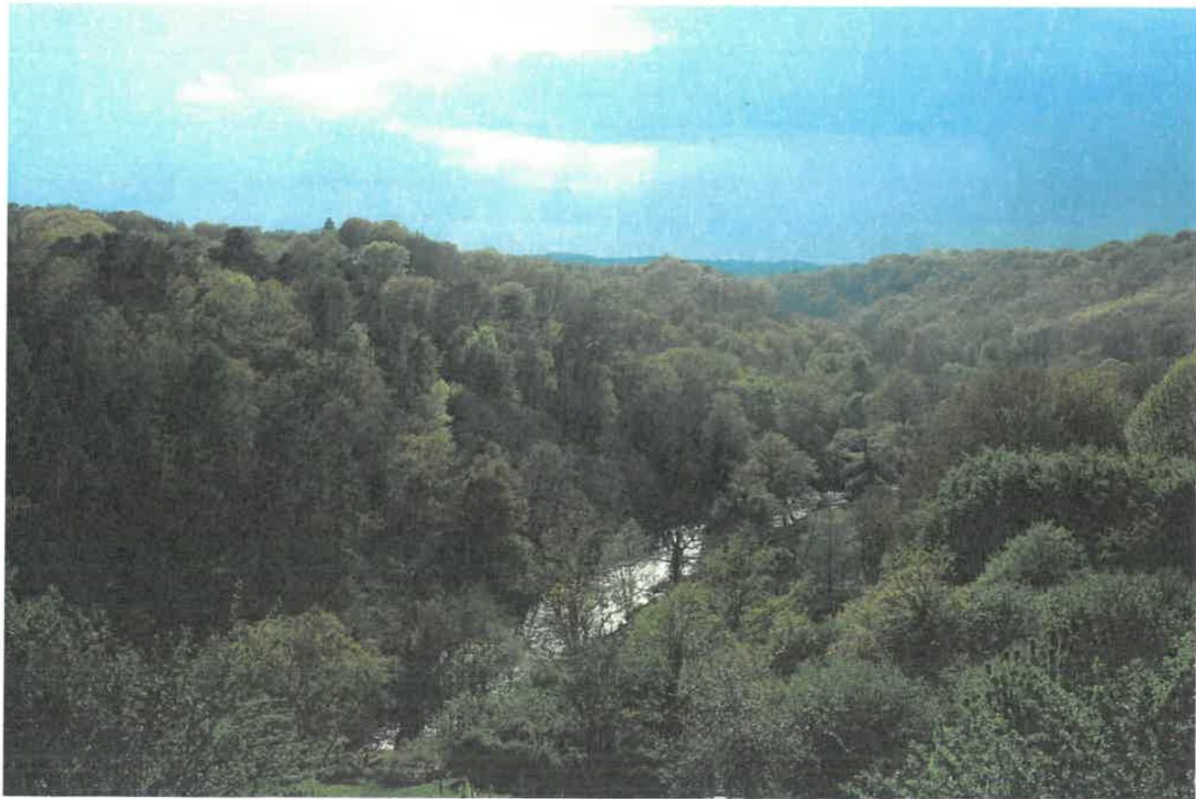
- sans titre-6865.jpg