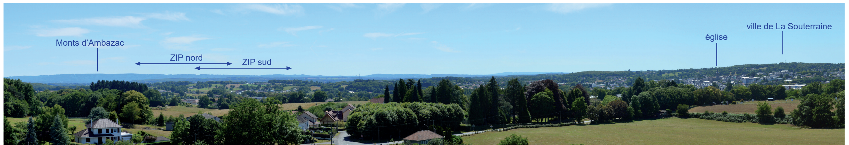
Photographie 20 : Vue depuis le sommet de la tour de Bridiers