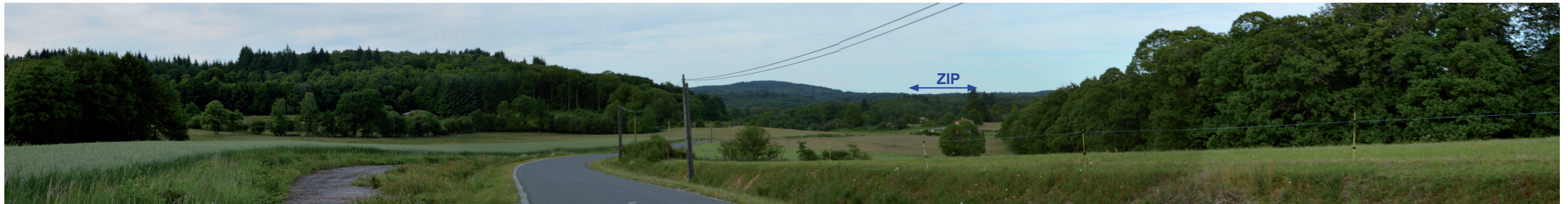
Photographie 22 : Vue depuis la D44a, en limite du périmètre du site inscrit du lac de St-Pardoux