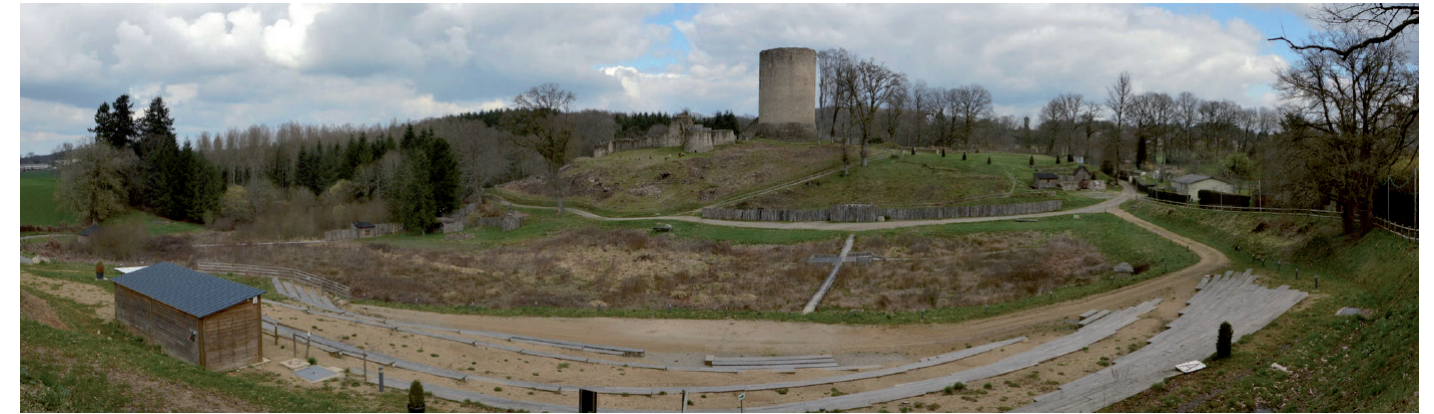
Photographie 29 : Site de l'ancien château de Bridiers

Le sommet de la tour offre une vue panoramique sur les environs. Etant donné la hauteur de la tour, la ZIP sera perceptible. Comme il s'agit d'un lieu d'observation, de contemplation du paysage, un éventuel projet éolien constituera par conséquent un élément bien identifiable, même à cette distance. L'emprise de la ZIP est toutefois limitée au regard de l'étendue du panorama. La sensibilité de ce site est faible.