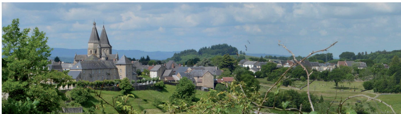
Photographie 23 : Bourg de Bénévent-l'Abbaye

Le village est situé au pied du Puy de Gaud, sur une zone de plateau dominée par les Monts de Saint-Goussaud. Aucune vue n'est possible depuis le centre historique en raison des effets d'écran liés au bâti et à la végétation. Des visibilitées et covisibilitées sont possibles depuis le périmètre de la ZPPAUP, mais il s'agit de vues brèves où la ZIP est à peine perceptible en raison de la distance (environ 14-15 km) et de l'importance des structures arborées (cf. photographies page suivante). La sensibilité de la ZPPAUP est très faible.