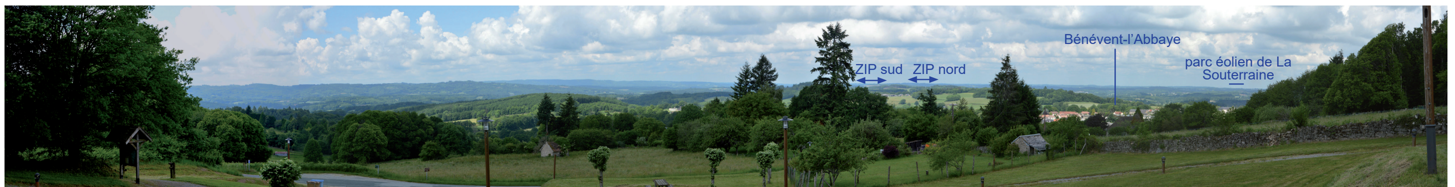
Photographie 28 : Vue panoramique depuis la table d'orientation du Puy de Gaud, à 14,5 km de la ZIP