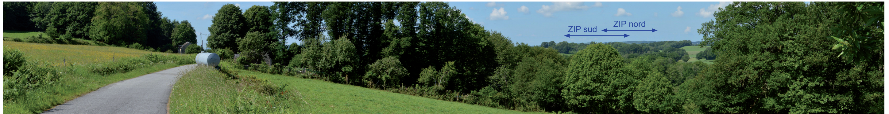
Photographie 27 : Vue depuis les rebords de la vallée de la Gartempe, à 7,3 km de la ZIP

Des visibilitées et covisibilitées sont possibles en rebord de vallée (cf. photographie 30 ci-dessous). Ces dernières sont toutefois peu fréquentes en raison de l'importance des structures végétales (haies, bosquets). L'emprise de la ZIP est peu importante et sa prégnance faible. La sensibilité de ce site est faible.