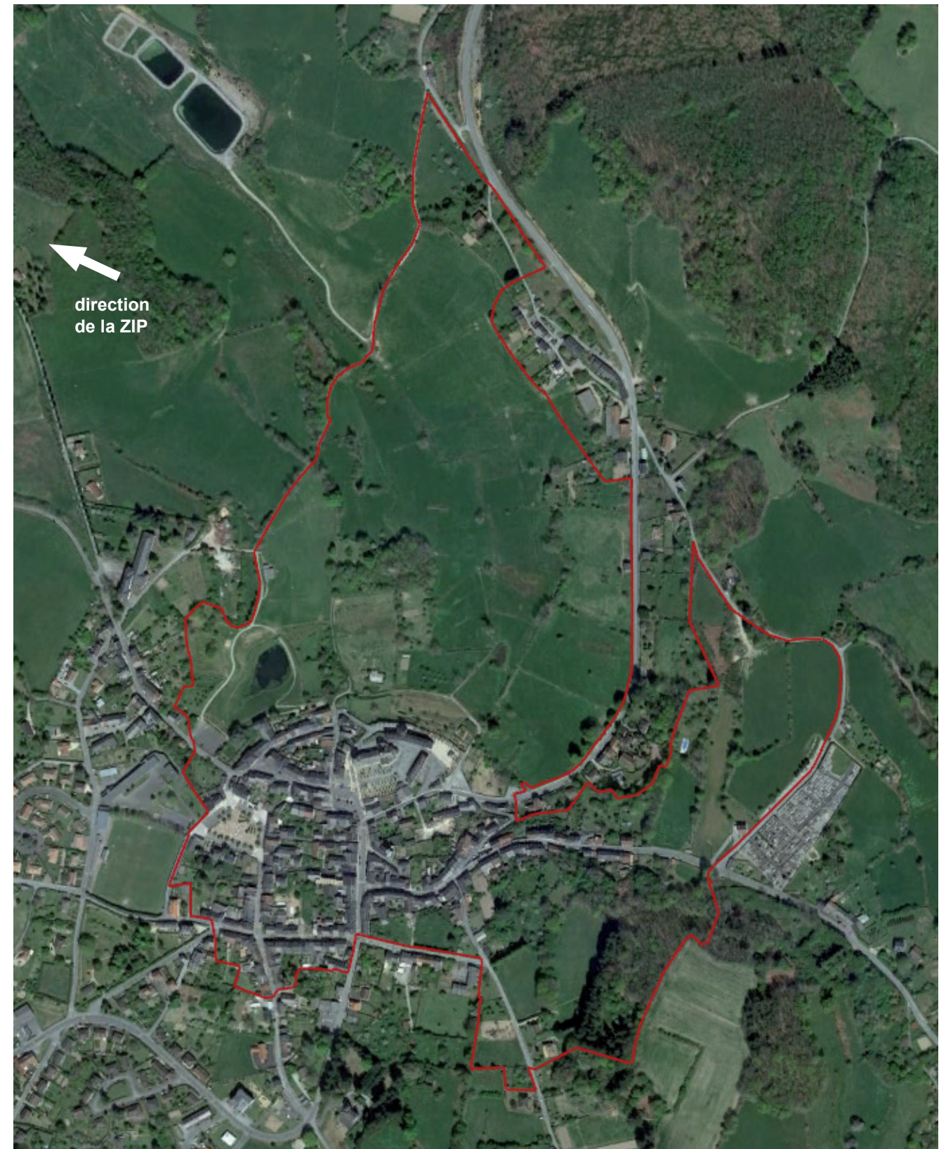
Carte 23 : ZPPAUP de Bénévent-l'Abbaye