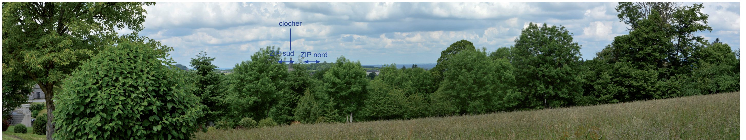
Photographie 25 : Covisibilité avec l'église depuis le cimetière