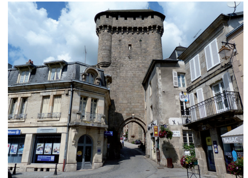
Photographie 19 : La porte Saint-Jean

Les étages de la porte sont accessibles au public. Au dernier niveau, les créneaux offrent une vue panoramique sur la ville. La ZIP sera perceptible à l'horizon dans le lointain (10 km). Aucune covisibilité n'a en revanche été identifiée. La sensibilité de ce monument est faible.