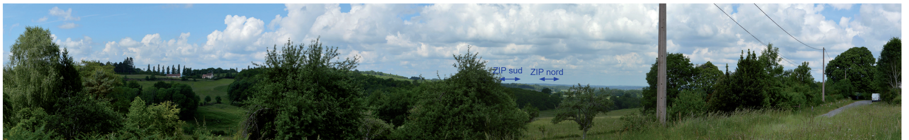
Photographie 26 : Vue depuis la D912A1, à l'extrémité nord de la ZPPAUP