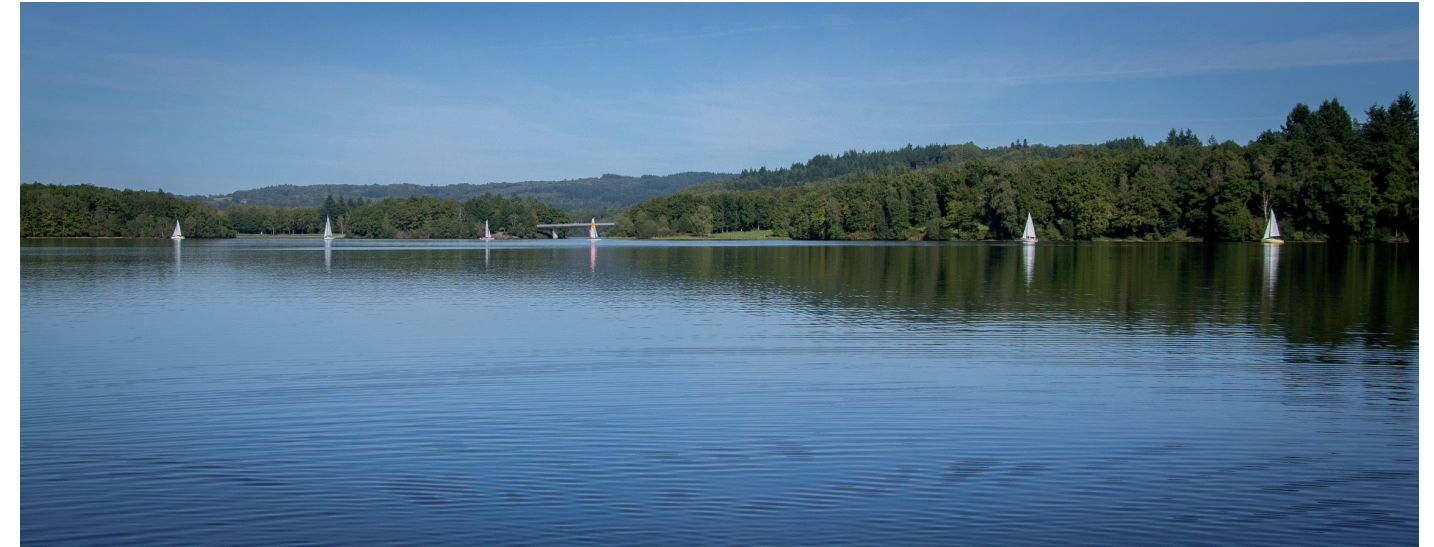
Photographie 21 : Le lac de Saint-Pardoux

Aucune vue sur la ZIP n'est possible depuis les berges et les secteurs touristiques. Les hauteurs des puys à l'ouest ainsi que la route D44a, en limite du périmètre du site inscrit et à l'écart du lac, permettent quelques rares échappées visuelles lointaines (cf. Photographie 22 ci-contre). Il s'agit toutefois de vues anecdotiques car elles sont ponctuelles et depuis des lieux très peu fréquentés. De plus, la ZIP est à très peu perceptible en raison de la distance et des masques végétaux (boisements). La sensibilité de ce site est très faible.