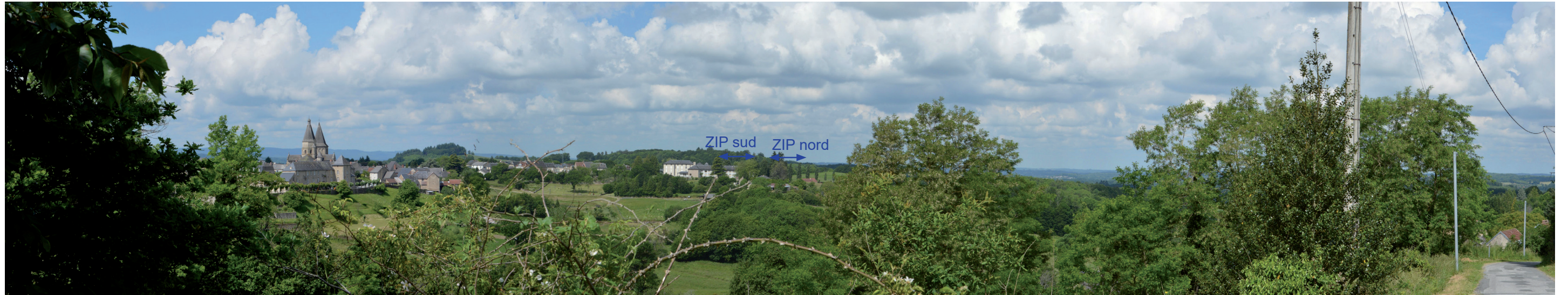
Photographie 24 : Covisibilité avec l'église et la silhouette du bourg de Bénévent-l'Abbaye