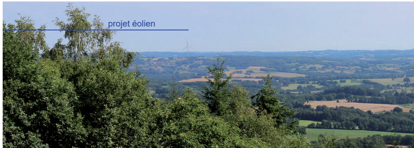
Photographie 159 : Photomontage depuis le panorama de l'Oratoire, à 15,4 km (PM 7)