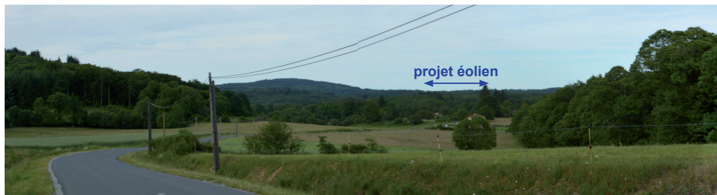
Photographie 158 : Vue depuis la D44a, en limite du périmètre du site inscrit du lac de St-Pardoux, à 16,9 km

Le projet éolien n'est pas perceptible depuis le lac et ses abords. Seule une échappée visuelle a été identifiée depuis la D44A à l'ouest, en limite du périmètre du site inscrit. Les éoliennes sont toutefois lointaines (16,9 km) et ne sont pas en covisibilité avec le lac, qui n'est pas perceptible. L'impact du projet éolien sur ce site est très faible, voire nul.