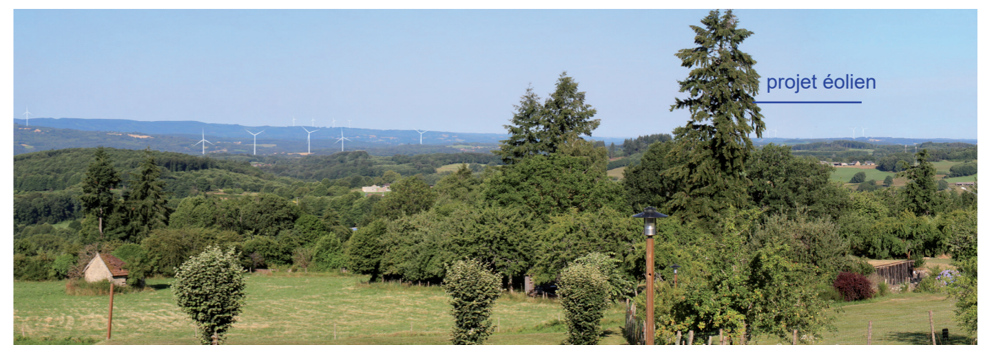
Photographie 162 : Photomontage depuis la table d'orientation du Puy du Gaud, à Bénévent-l'Abbaye, à 14,7 km (PM 10)