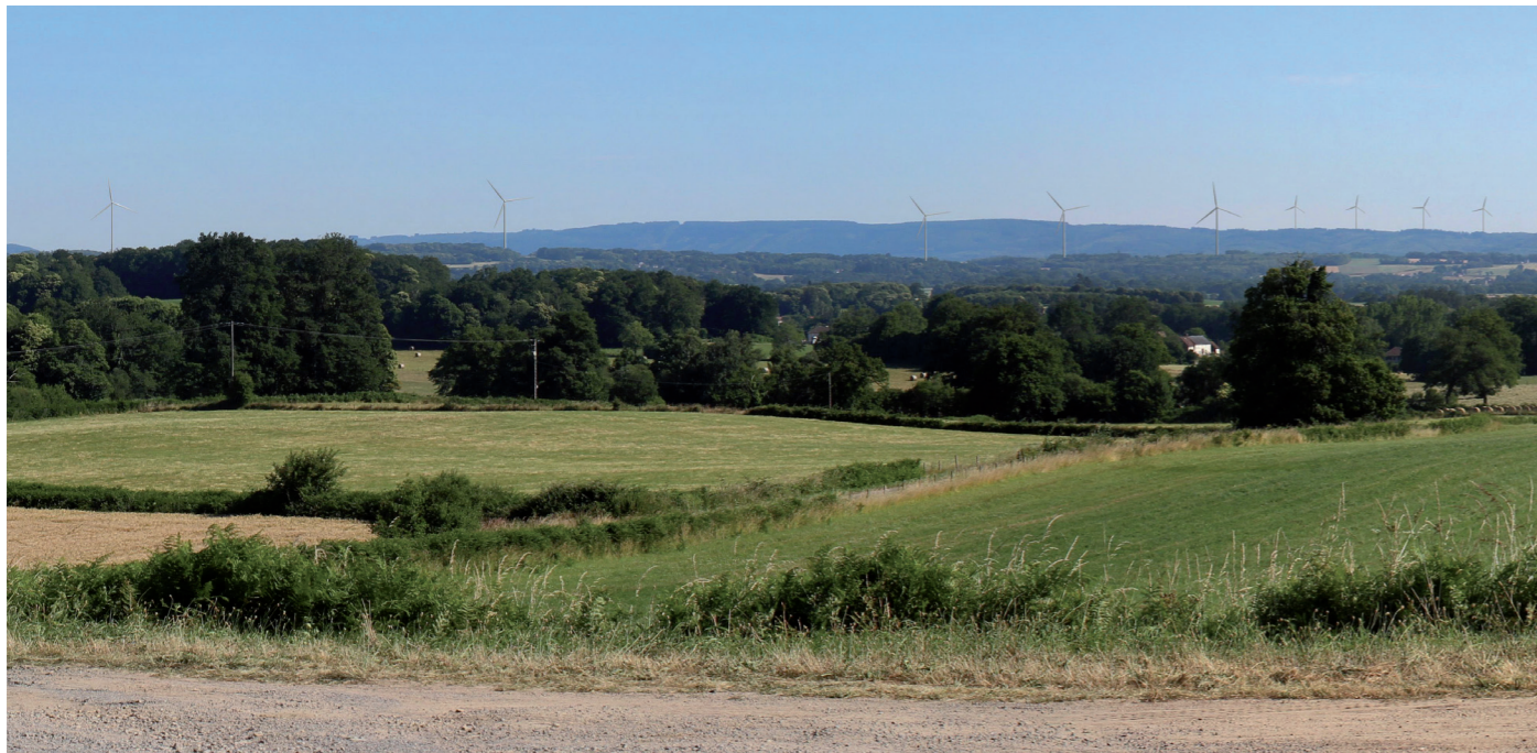
Photographie 156 : Photomontage depuis la D73A1 à proximité de la N145, à l'ouest de Saint-Maurice-la-Souterraine, à 7,8 km (PM 4)