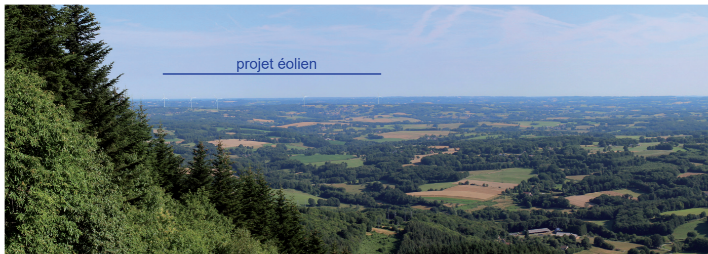
Photographie 160 : Photomontage depuis la base de parapente, à 9,9 km (PM 9)