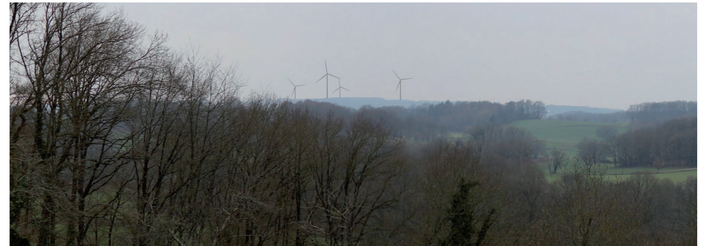
Photographie 161 : Photomontage depuis la D56, dans le site emblématique de la vallée de la Gartempe, à 7,6 km (PM 6)