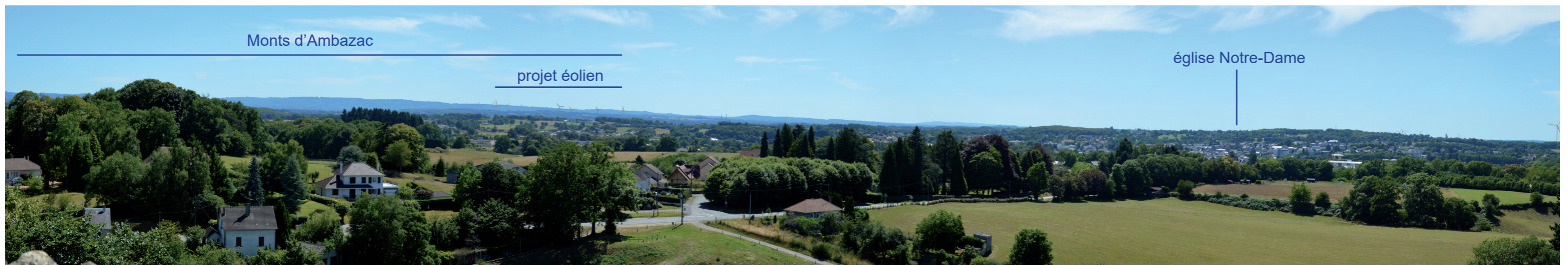
Photographie 157 : Photomontage depuis le sommet de la Tour de Bridiers, à 11,8 km (PM 5)

Le sommet de la tour offre une vue panoramique sur les environs. Le projet éolien sera perceptible, en covisibilité avec les Monts d'Ambazac et la ville de La Souterraine (cf. photomontage ci-dessous). Celui-ci occupe une emprise relativement limitée au regard de l'étendue du panorama. L'impact du projet éolien sur ce monument est faible.