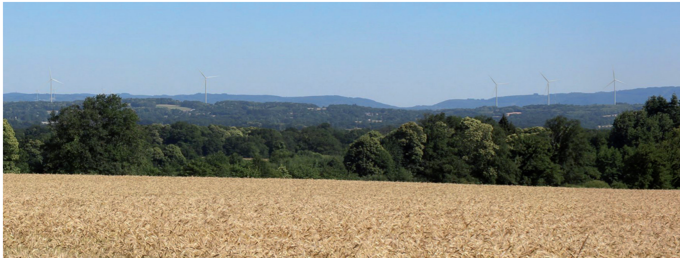
Photographie 155 : Photomontage depuis la N145 au niveau de l'échangeur de la Croisière, à 7,5 km (PM 3)

Cette route, en partie en 2x2 voies traverse le nord de l'AEE selon un axe est/ouest. Elle passe à 7,2 km au plus proche du projet éolien. Elle traverse les secteurs bocagers de la Basse-Marche. Quelques petites portions de la route permettent des échappées visuelles lointaines en direction du projet éolien, avec la silhouette des Monts d'Ambazac en arrière-plan (cf. Photographie 155). Ces vues sont en général assez brèves. Elles sont localisées à l'ouest de l'AEE. L'impact du projet éolien sur cette route est nul à modéré pour les portions concernées par des visibilitées.