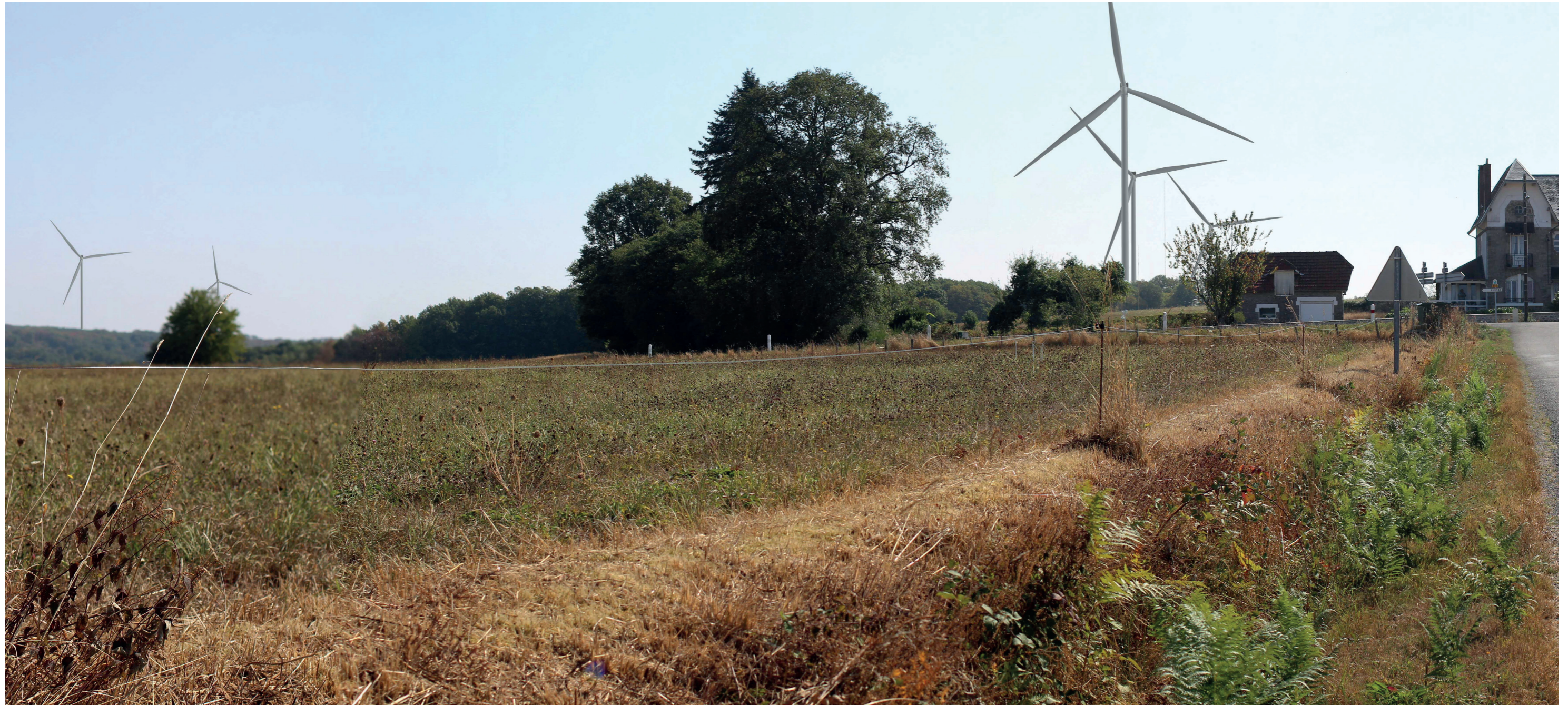
Photomontage à 50° L'observateur doit s'éloigner de 42 cm pour une observation réaliste sur une impression A3.

Commentaire : L'habitation située la plus à l'est du hameau (celle que l'on voit sur le photo) ainsi que sa route d'accès ouest (D51A) permettent des vues dégagées sur le projet éolien. Les deux éoliennes nord apparaissent ici à l'écart sur la gauche, tandis que les trois éoliennes sud apparaissent à proximité immédiate de l'habitation. Celles-ci, surtout E1, paraissent très imposantes en raison des rapports d'échelle très contrastés avec le bâti. L'emprise visuelle de cette éolienne est importante en hauteur mais aussi en largeur (rotor). Celle-ci provoque un effet de dominance par rapport à la maison.