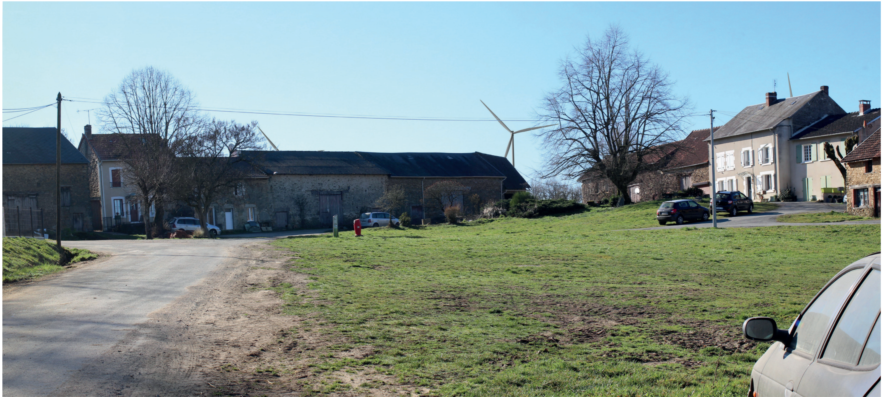
Photomontage à 50° L'observateur doit s'éloigner de 42 cm pour une observation réaliste sur une impression A3.

Commentaire : L'ouest du hameau de Lascoux permet des vues sur les trois éoliennes sud. Celles-ci sont ici visibles à l'arrière-plan des bâtiments. Le contraste d'échelle est assez important, les éoliennes s'élevant au-dessus des toitures. Les deux éoliennes nord ne sont pas visibles, masquées par le relief, la végétation et le bâti. Malgré le faible nombre d'éoliennes visible, l'emprise en largeur du parc est importante.