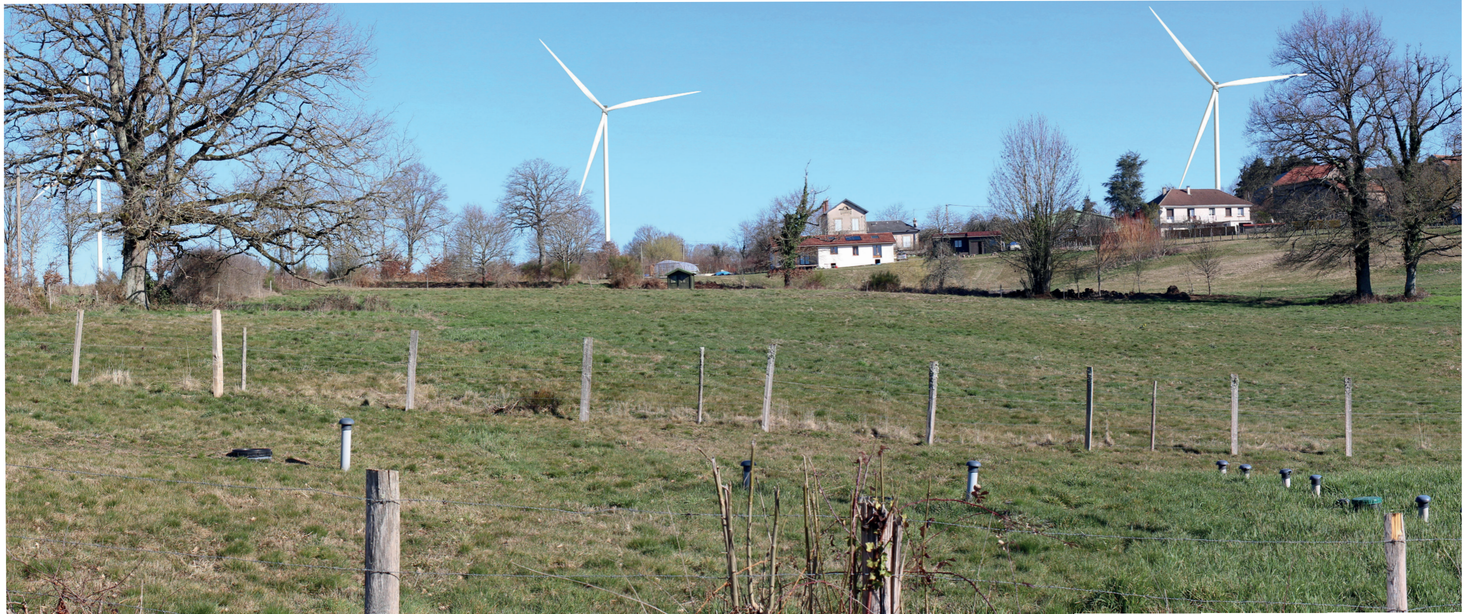
Photomontage à 50° L'observateur doit s'éloigner de 42 cm pour une observation réaliste sur une impression A3.

Commentaire : L'extrémité ouest du hameau des Gouttes offre une vue dégagée en direction des trois éoliennes sud. E1 est peu visible, à l'arrière d'un gros chêne, mais les deux autres éoliennes sont en revanche très prégnantes en raison de leur proximité. Les différentes structures végétales accompagnent visuellement les éoliennes. La covisibilité avec des habitations du hameau du Cluzeau induit des rapports d'échelle contrastés. L'emprise des rotors les rend d'autant plus imposantes.