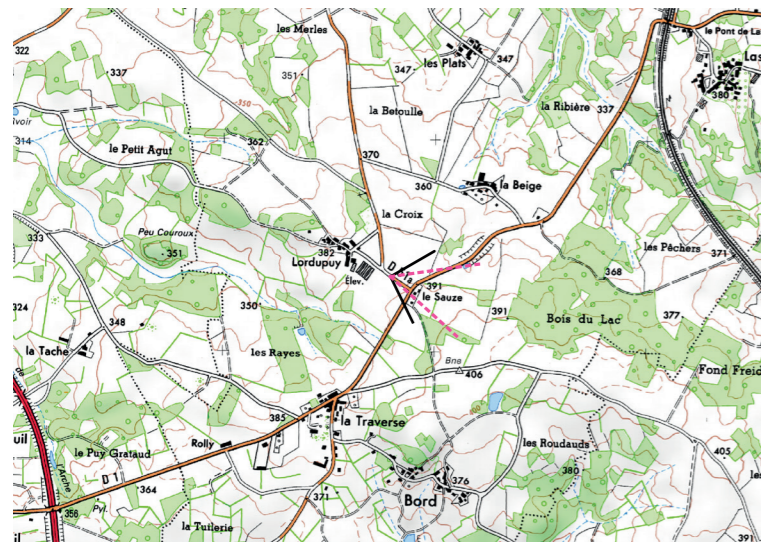
Localisation de la prise de vue