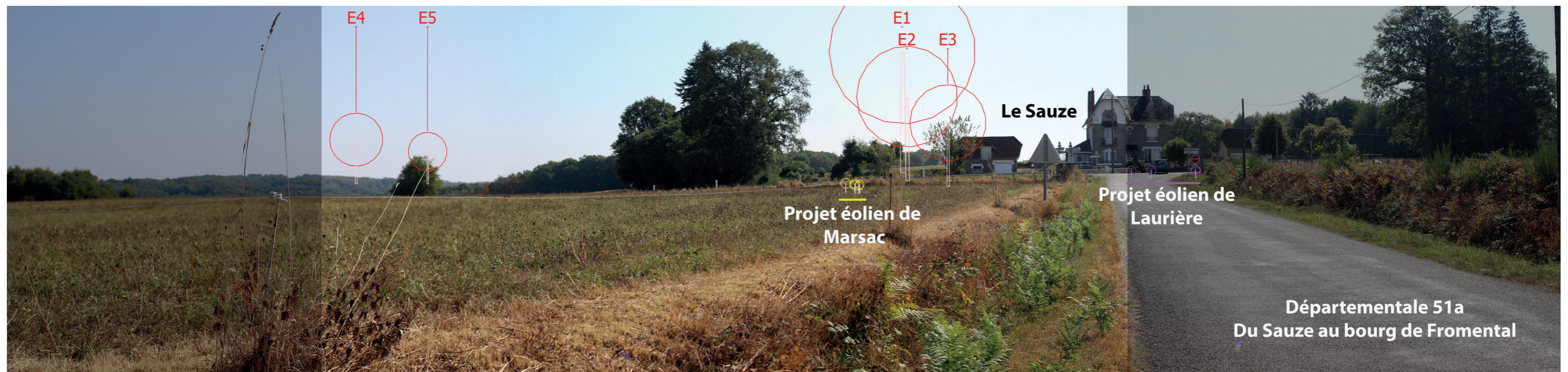
Photographie de l'état simulé