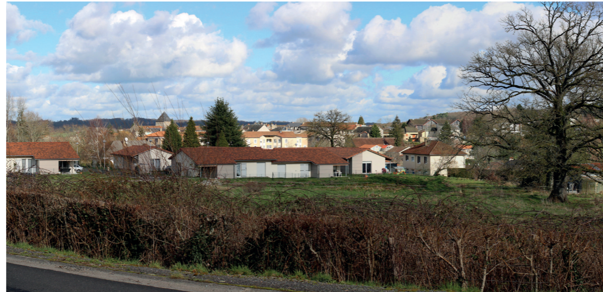
Photographie de l'état simulé