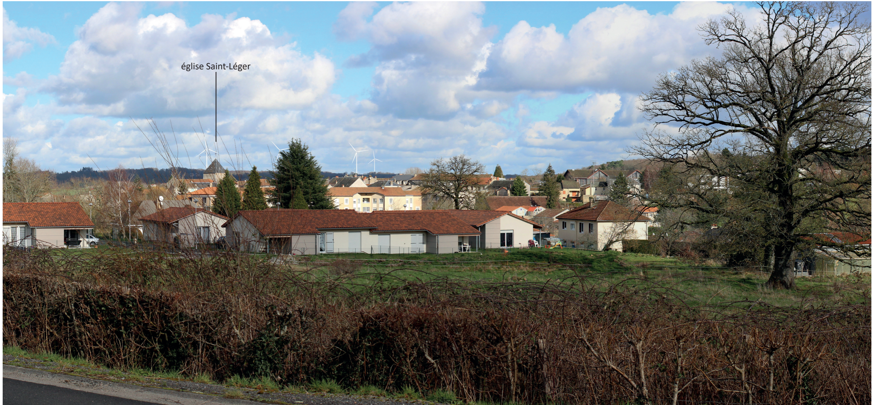
Photomontage à 50° L'observateur doit s'éloigner de 42 cm pour une observation réaliste sur une impression A3.

Commentaire : La présence de parcelles non construites en périphérie des quartiers résidentiels de la Roche, au sud-ouest de Bessines-sur-Gartempe, ainsi que la situation dominante permettent de percevoir le projet éolien, qui apparaît en covisibilité avec le bourg et son église (monument historique). Une des éoliennes est ici masquée par un conifère, ainsi qu'une autre partiellement, mais l'implantation est lisible. Les éoliennes apparaissent au-dessus de la ligne d'horizon formée par le relief, qui domine légèrement la silhouette du bourg. Leur relatif éloignement et par conséquent leur emprise en hauteur limitée permettent d'éviter les effets de surplomb par rapport aux habitations. Le projet occupe une emprise en largeur limitée (pas d'effet de barrière visuelle) mais les éoliennes restent prégnantes. Une éolienne apparaît à l'arrière du clocher, se juxtaposant à l'image de l'église. Celle-ci occupe une emprise visuelle équivalente au clocher, il y a par conséquent un effet de concurrence visuelle. A noter qu'il ne s'agit pas d'une vue emblématique sur le village, et que cette dernière est susceptible de ne plus exister en cas de construction sur la parcelle au premier plan.