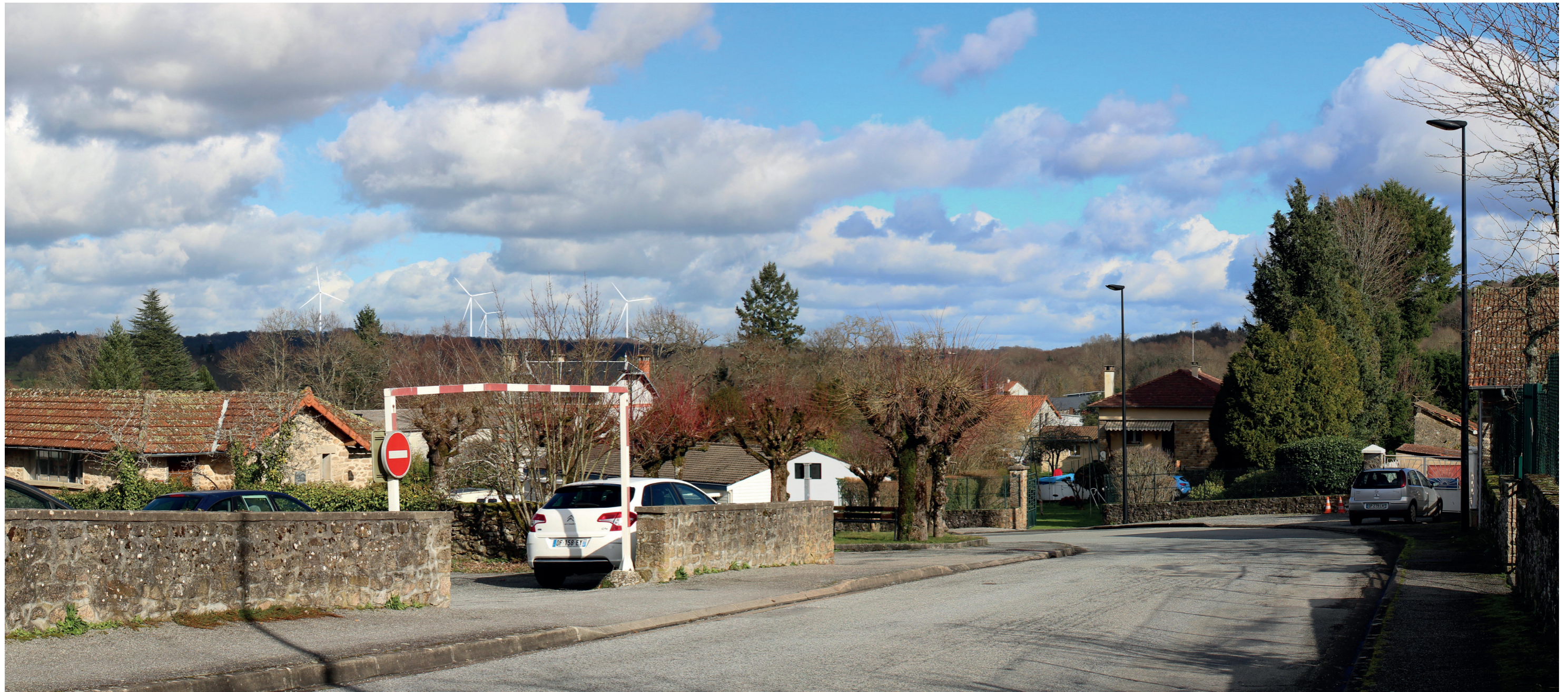
Photomontage à 50° L'observateur doit s'éloigner de 42 cm pour une observation réaliste sur une impression A3.

Commentaire : La situation du bourg en surplomb de la vallée de la Gartempe permet de percevoir le projet éolien. Les cinq éoliennes paraissent regroupées, avec une implantation lisible (trois éoliennes alignées et deux en arrière-plan). L'une des éoliennes est ici masquée par la végétation. Celles-ci seront assez prégnantes en hiver mais plus discrètes en été en raison de la végétation arborée qui accompagne les habitations et filtre les vues. Les rapports d'échelle avec le relief sont équilibrés, l'emprise en hauteur des éoliennes apparaissant comparativement limitée (pas d'effet de surplomb ou de dominance). L'emprise horizontale est également limitée (pas d'effet de «barrière»).