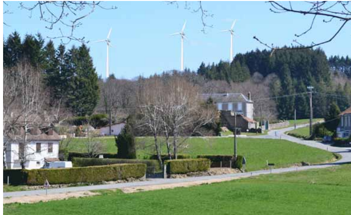
La Bezassade ▶