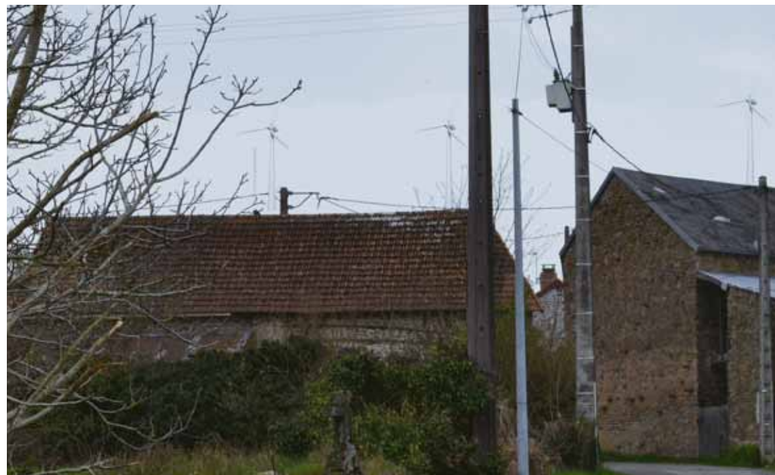
La Pradelle ▶