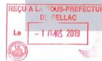
Figure 1 : Délibération ayant pour objet l'arrêt du projet de Plan Local d'Urbanisme intercommunal