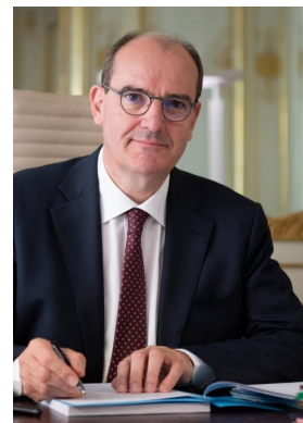
Jean CASTEX Premier Ministre

Nous avons conscience que nous sommes à une époque charnière de notre histoire industrielle, comme toujours, ces moments sont passionnants quand ils sont au croisement de ce que le volontarisme politique auquel je suis particulièrement attaché et le génie français, dont je ne cesse d'être admiratif, sont capables de faire de mieux. Une fois encore, croyez-moi, si elle s'en donne les moyens, la France saura inventer des solutions. »